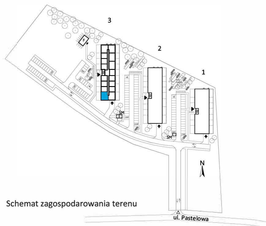
Schemat zagospodarowania terenu