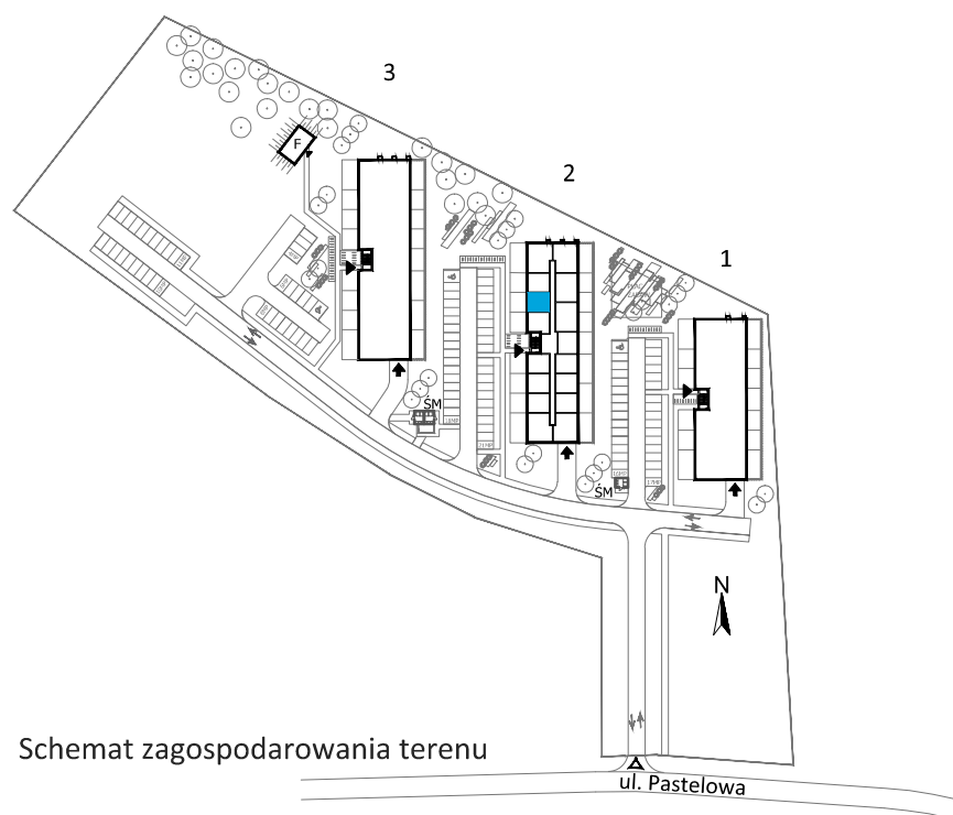
Schemat zagospodarowania terenu

Wyposażenie przedstawione na karcie jest tylko w celach pokazania przykładowej aranżacji, nie stanowi zobowiązania umownego.